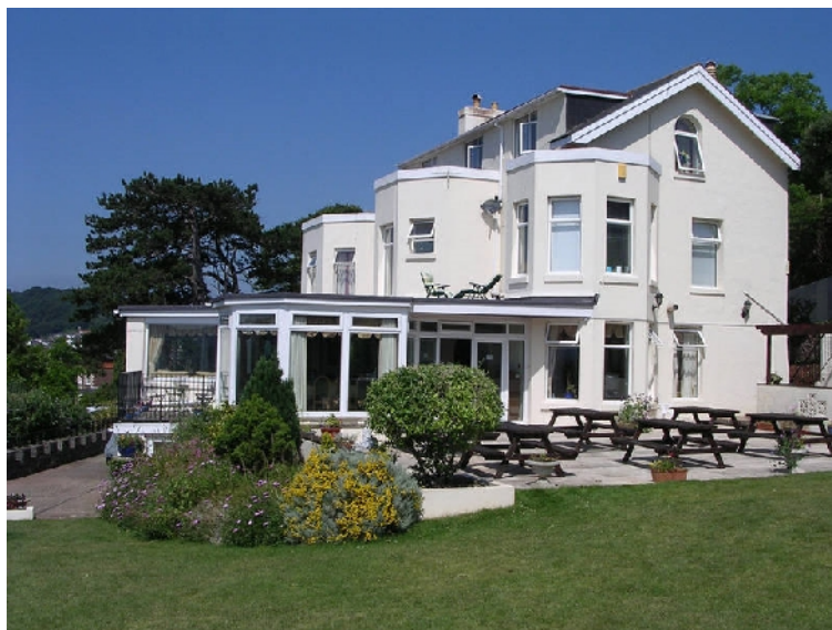
Residencia Hunter's Lodge

La residencia está situada en la cima de una colina y con vistas al mar y está a 10 minutos andando de la escuela. Las habitaciones son individuales con cuarto de baño dentro incluido. La residencia tiene también una cocina compartida, salón, salón de TV y un jardín y un patio de verano. También ofrece conexión Wi-Fi. La manutención es con desayuno que se toma en la cafetería de la escuela y el resto de las comidas se pueden hacer en la cafetería de la residencia o de la escuela con precios de estudiante.